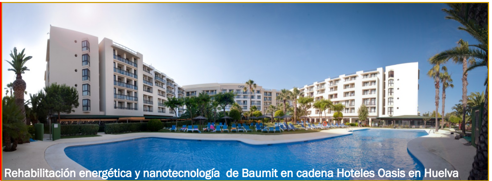
Rehabilitación energética y nanotecnología de Baumit en cadena Hoteles Oasis en Huelva

Fachada súperaislante con revoco desarrollado con nanotecnología